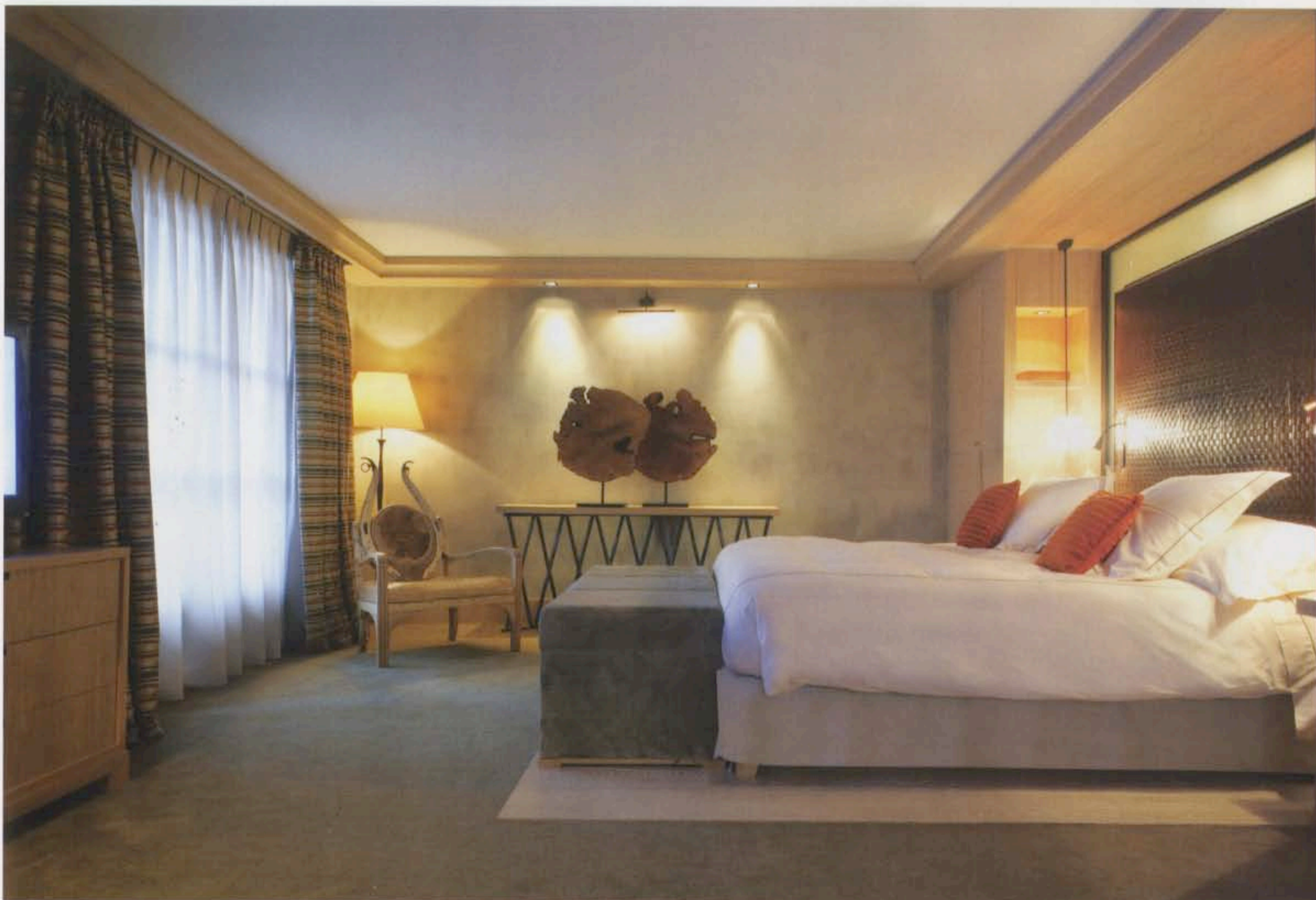
Hôtel Cheval Blanc à Courchevel au coeur de 3 vallées.