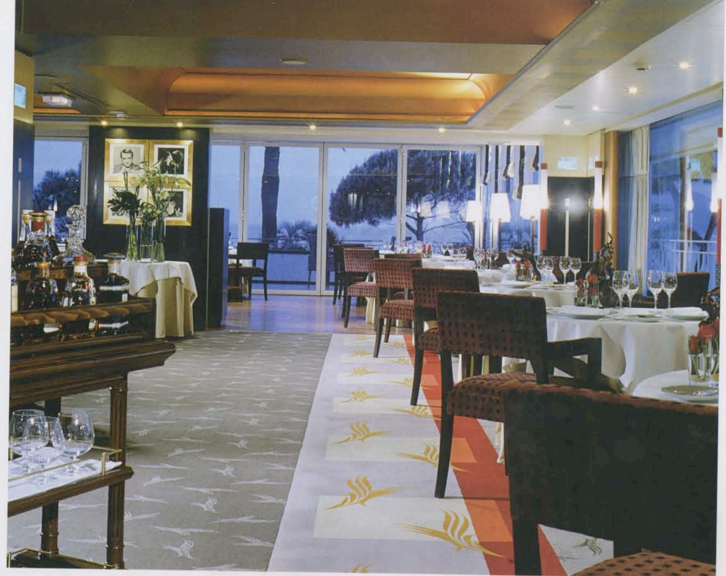
A gauche : Casino Groupe Tranchant à Bâle en Suisse. A droite : restaurant la Palme d'Or, à l'hôtel Martinez de Paris