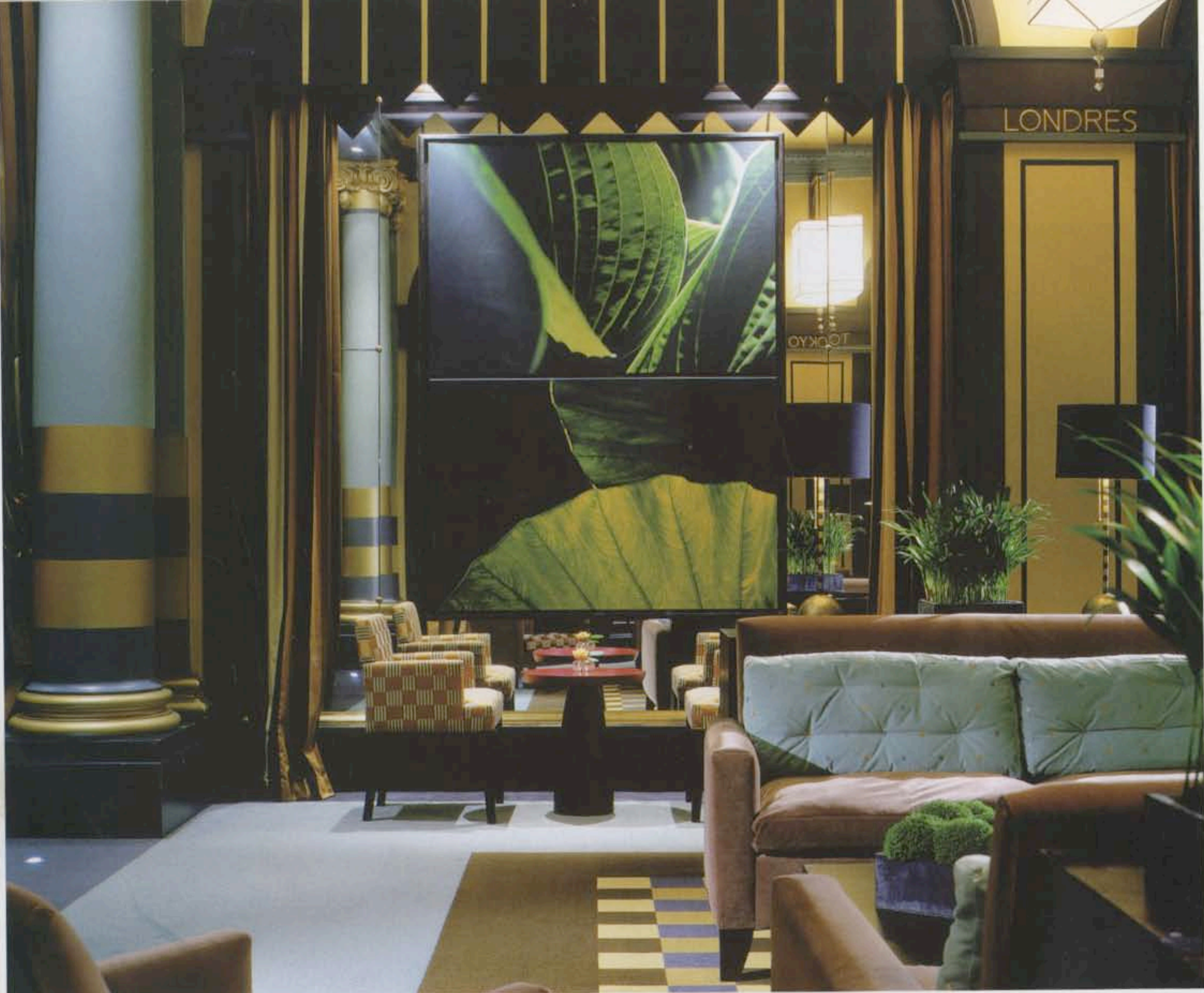
L'Hôtel Ambassador "art déco chic" du boulevard Haussman, quartier de l'Opéra