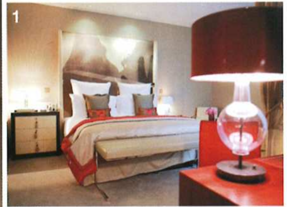
1.フューシャや紫の華やぎ色がフェミニンさを感じさせるデラックスルーム(約40㎡、1泊423€〜)。2.3.パリ中を見渡せる広いダイニングテラスや、プライベートジム付きの2階建てスイート、ロイヤル・マンダリン(350㎡、1泊2万€)。