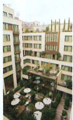
庭園を囲むようにして客室が並ぶ造り。