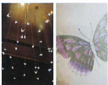
シンボルの蝶のモチーフは再生の意。

1.2. 折り紙の花のような「オートクチュールの」壁と、ドームのようなモダンスタイルの、「憩いの隠れ家」へのエントランス。3. トリートメントルームは、全室個室の贅沢な造り。